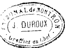
Table Biennale des actes de Mariage de la Commune de Saint Martial de Vallette, du premier janvier mil huit cent quatre vingt treize, au trente un Decembre mil neuf cent dix.

Dressé en exécution du décret du vingt Juillet mil huit cent sept