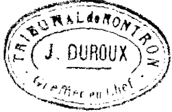
Table décennale des actes de Naissance de la Commune de Javerlhac du premier janvier mil huit cent quatre vingt neuf, au trente un Décembre mil neuf cent deux,

Dressée en exécution du décret du vingt juillet mil huit cent sept