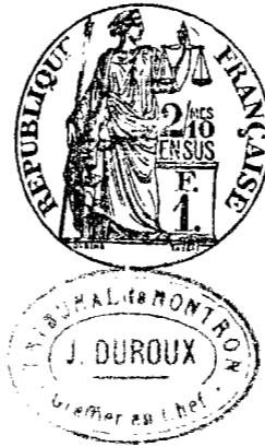
Table décennale des actes de décès de la Commune de Javerlhac, du premier janvier mil huit cent quatre vingt seize, au premier janvier mil neuf cent trois. Dressé en exécution du décret du vingt juillet mil huit cent sept