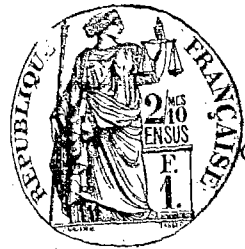
Table décennale des actes de naissances de la commune d'Augignas du premier janvier mil-huit cent quatre-vingt treize au premier janvier mil neuf cent trois dressée en exécution du décret du vingt juillet 1897.