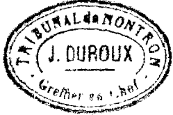
Table Décennale des Actes de Décès De la Commune de Sarrazac

Du premier janvier mil huit cent quatre vingt huit au trente et un décembre mil neuf cent deux Dressés en exécution du Décret du 20 juillet 1887