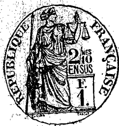
Table Générale des Actes de Décès de la commune de Saint-Cyr les Champagnes du premier janvier mil huit cent quatre-vingt-treize au premier janvier mil neuf cent trois, dressée en exécution du Décret du 20 juillet 1807