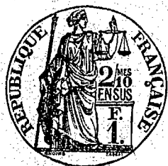
Table décennale des actes de naissance de la Commune de Saint-Pardoux-la-Rivière du premier janvier mil huit cent quatre- vingt-trois sur lequel en Décembre mil neuf cent deux, l'acte en exécution du décret du vingt juillet mil huit cent sept