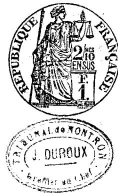
Table décennale des actes de Mariage de la Commune de Bussacrolles du premier Janvier mil huit cent quatre vingt treize au premier Janvier mil neuf cent trois. Dressée en exécution du décret du vingt juillet mil huit cent sept