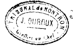
Table décennale des Actes de Naissance de la commune de Boulbunec du premier janvier mil huit cent quatre vingt treize au trente un décembre mil neuf cent deux, dressée en exécution du décret du 20 juillet 1807.