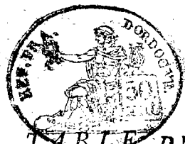
TABLE DÉCENNALE des Actes de Décès — de la commune d'andrievaux merlande depuis l'époque de l'exécution de la loi du 20 septembre 1792, jusqu'au 1 er vendémiaire an 11, dressée conformément aux dispositions de ladite loi, et de l'arrêté des Consuls, du 25 vendémiaire an 9.