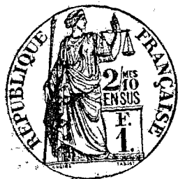
Table décennale des actes de décès de la Commune de La Coquille, du premier janvier mil huit cent quatre vingt trois au premier Janvier mil neuf cent trois, dressée en exécution du décret du 20 juillet 1807